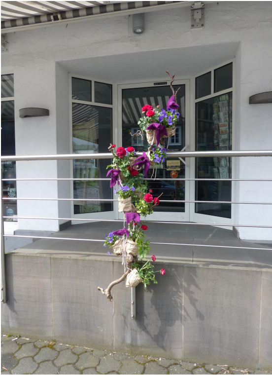
L' arbre de Mai