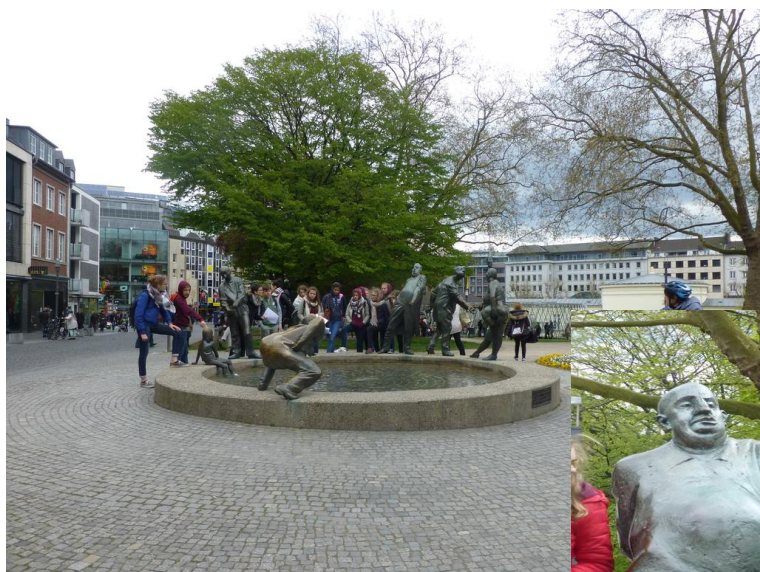
La fontaine du cycle de l'argent